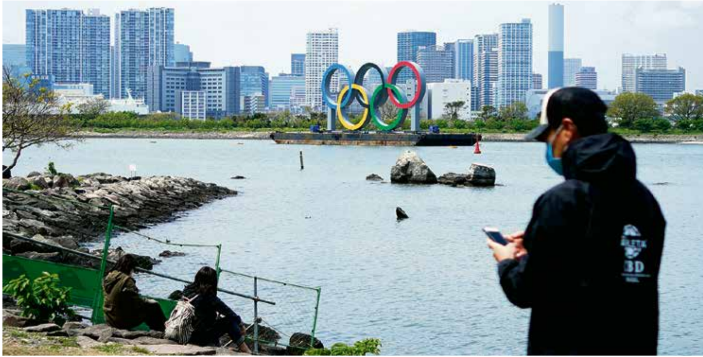
Koronakríza spôsobila vo svete športu nielen preloženie OH v Tokiu na budúci rok, ale aj množstvo ďalších problémov.