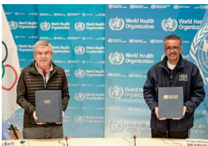
Prezident MOV Thomas Bach a generálny riaditeľ WHO Tedros Adhanom Ghebreyesus po podpise memoranda.

Pri tejto príležitosti Bach opäť zdôraznil význam spolupráce s WHO aj vzhľadom na organizáciu olympijských hier v Tokiu v lete 2021 a na spoločný boj proti pandémie koronavírusu. „Nový dátum konania olympijských hier je ešte ďaleko a je príliš skoro špek-