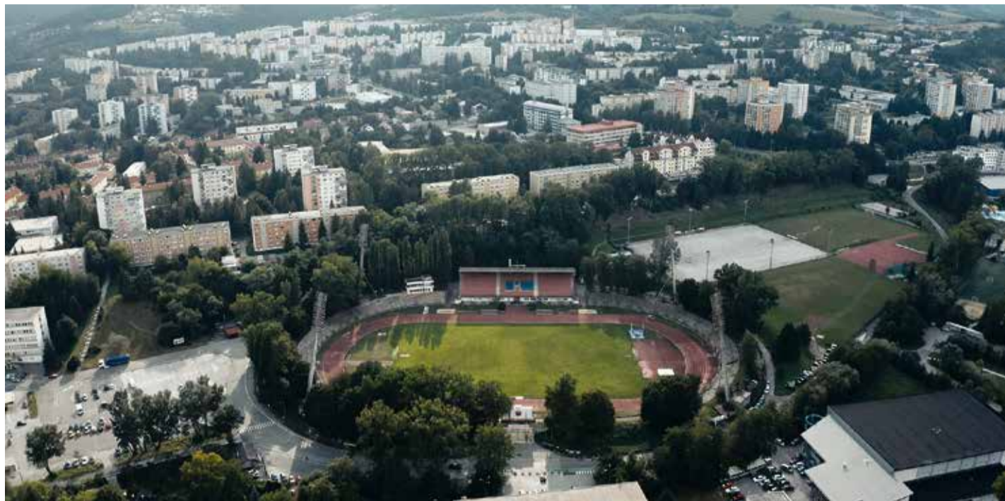
Centrom XVI. letného EYOF v roku 2022 bude športový areál na banskobystrických Štiavničkách.