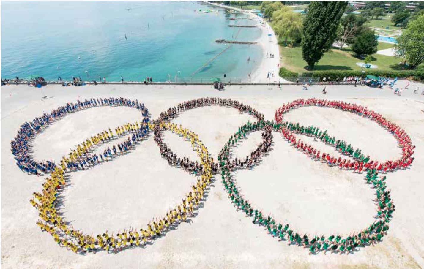
Ilustračná fotografia k Olympijskému dňu.