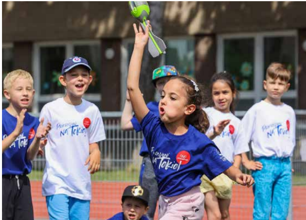
Momentka z Olympijského dňa na ZŠ Kalinčiakova v Bratislave.