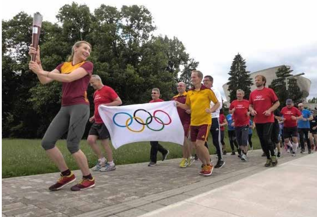
V Banskej Bystrici niesla olympijský oheň Anastasia Kuzminová.