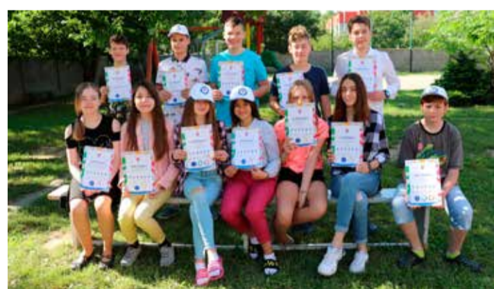
Žiaci s certifikátmi z pilotného ročníka OLOV.

Celoslovenské finále pilotného ročníka OLOV sa malo uskutočniť 23. – 25. júna v rámci najtradičnejšej mládežníckej olympiády Ka-