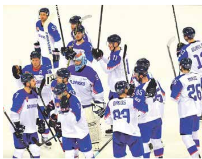
Slovenskí hokejisti skončili na olympiáde na predposlednom mieste rovnako ako na predchádzajúcich hrách v Soči 2014.

vý rebríček znamená 120 bodov navyše. „Z takýchto sklamaní sa človek najviac naučí, ale mohli prísť neskôr. My sme to mali rozohrané dobre, stačilo si to jedným gólom uľahčiť,“ povedal pre agentúru TASR generálny manažér Miroslav Šatan po prehre s USA 1 : 5 a definitívnom vyradení tímu z olympijského turnaja. Aby sa Šatan a spol. vyhli náročnej olympijskej kvalifikácii, museli by na zostávajúcich dvoch svetových šampionátoch v Dánsku 2018 a na Slovensku 2019 uhrat' minimálne postup do štvrtfinále. Ani to však v súboji o spomínané ôsme miesto rebríčka nemusí v konkurencii Bieloruska, Nórska, Švajčiarska či Nemecka stačiť. Práve Nemecko urobilo ziskom striebra dôležitý